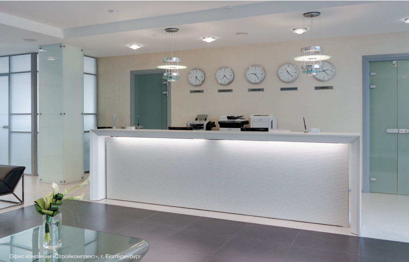
Офис компании «Стройкомплект», г. Екатеринбург