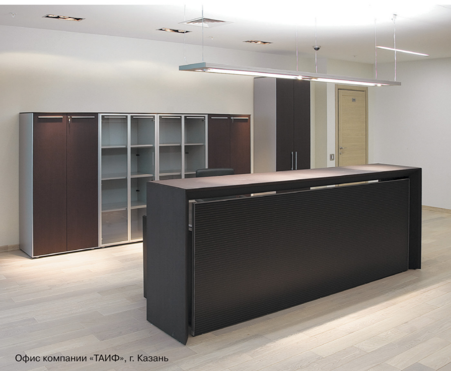
Офис компании «ТАИФ», г. Казань