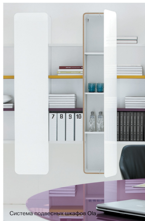
Система подвесных шкафов Ола