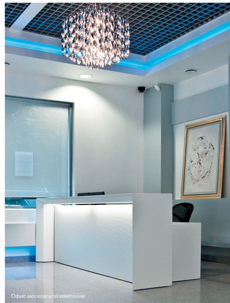
Офис московской компании