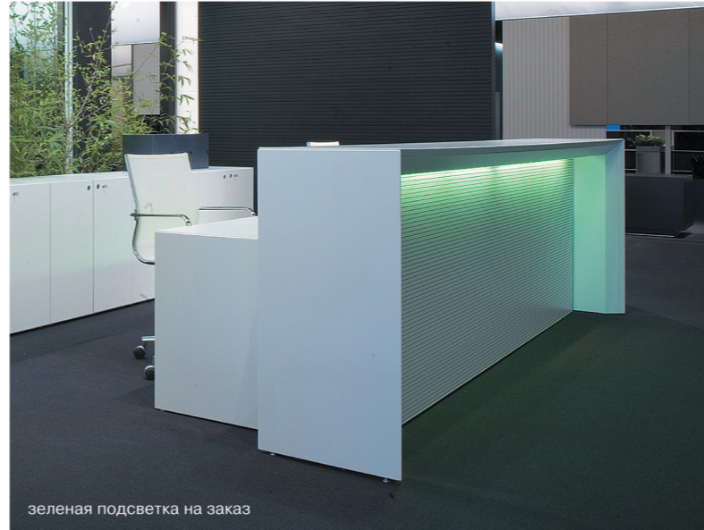
зеленая подсветка на заказ